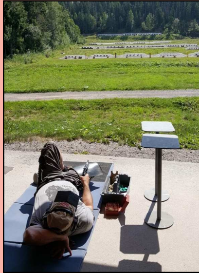
Die typische liegende Position „Dead Frog“, die eine sehr lange und genaue Visierlinie bietet.

Beim Silhouetten-Schießen wird auf spezielle Stahlziele in Tierform (Huhn, Schwein, Truthahn und Widder) geschossen, und zwar auf jeweils unterschiedliche Entfernungen. Die Auswertung ist ganz einfach: nur eine umgeworfene Figur zählt als Treffer, ein Wettkampf geht über 40 Schuss.